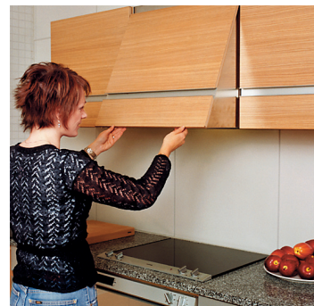
Läge helt öppen

Öppna spiskåpan genom att ta i kåpans underkant och samtidigt lyfta något och dra utåt. När spiskåpan öppnas tänds belysningen och luftflödet forceras. När spiskåpan inte används vid matlagning skall den av energiskäl vara stängd.