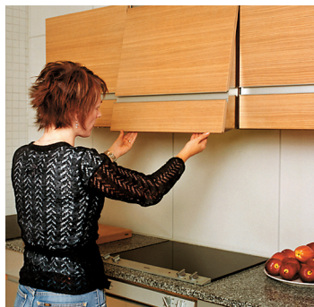
Läge halvt öppen