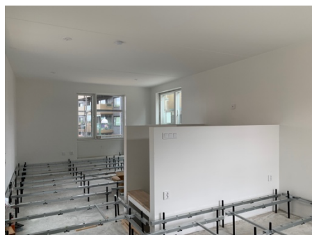
Plan 3 gathus